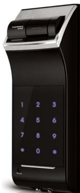
Vue côté extérieur