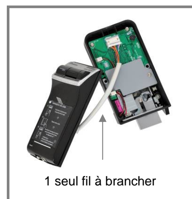
1 seul fil à brancher