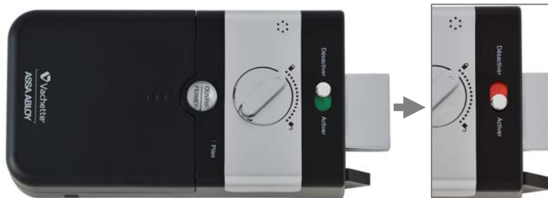
Vue côté intérieur