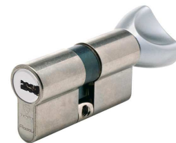
Cylindre à bouton