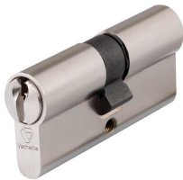
Cylindre à 2 entrées

Avant de passer votre commande, vous devrez identifier les cylindres en position sur vos portes