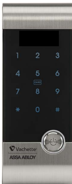
Vue côté extérieur