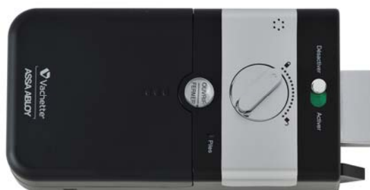
Vue côté intérieur