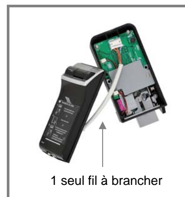
1 seul fil à brancher